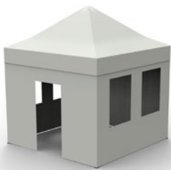
Mur avec porte