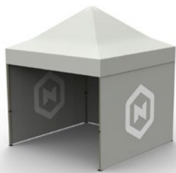
Double mur imprimé recto-verso