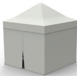
Mur plein divisé en 2 parties avec zip