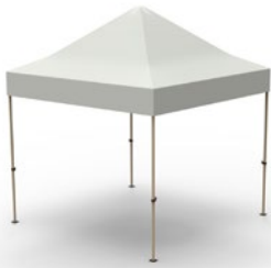
Tente sans murs