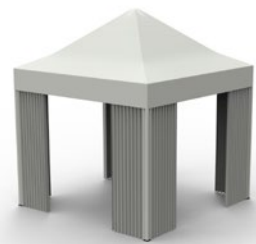
Murs-rideaux avec œillets