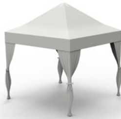
Rideaux pour les pieds – ficelés