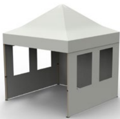
Mur avec fenêtres