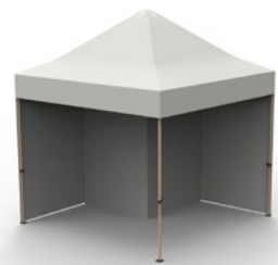
Paroi de séparation interne